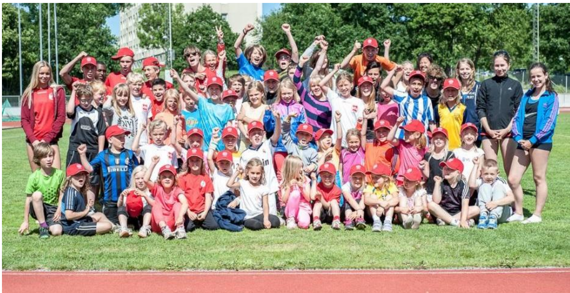
Friidrottsskolan är ett populärt arrangemang som varje sommar ger många barn möjlighet att prova på friidrott under lekfulla former.