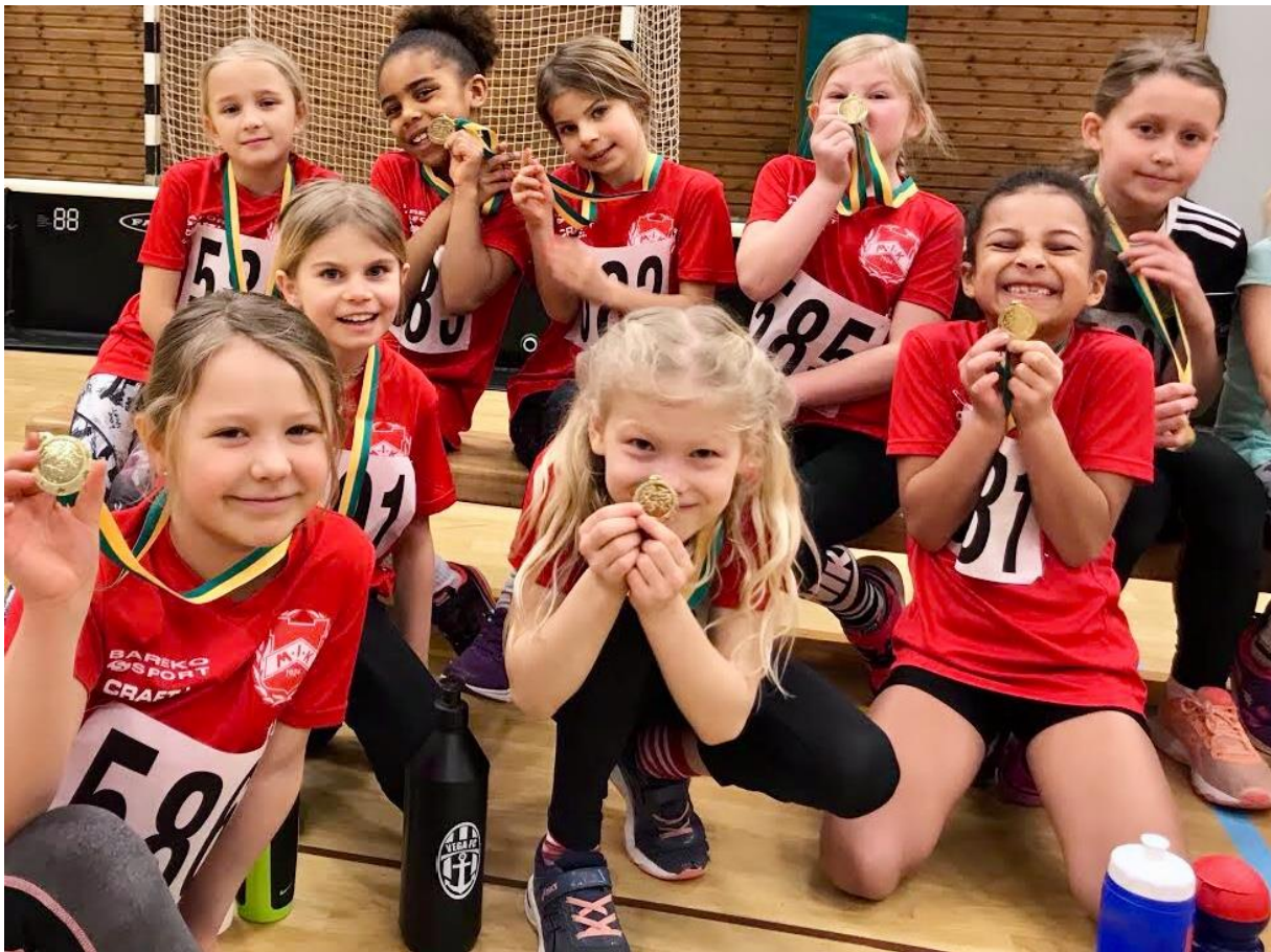
Många av våra aktiva tävlade framgångsrikt under året. Här en bild på 2011-gruppen i Haninge Open.

Västerås, Scandic Indoor Games, Lilla Globengalan, Hammarbyspelen, inomhus-DM, inomhus Junior-SM i Växjö, Inomhus Ungdoms-SM - Västerås, Svealandsmästerskapen inomhus i Örebro, Haninge Open, Kraftmätningen, Lilla Hammarbyspelen, Sista Chansen, Marsspelen i Örebro, Hellaskastet, Turebergstafetten, Mälaröspelen, Täby Open, Sprintkväll på Lidingöwallen, Danderyds Ungdomsspel, Veteran-DM, Stafett-SM i Stockholm, Katrineholmsspelen, Bauhausgalan, Tyresöspelen, SAYO, Ungdoms-DM, Världsongdomsspelen i Göteborg, Fortumspelen i Bollnäs, Kvarnsvedensspelen i Borlänge, Sparbanksspelen i Leksand, Ystadspelen, HAIS-spelen i Hässleholm, Westinghouse Gurkspel i Västerås, Junior-SM i Göteborg, Veteran-SM i Stockholm, Finnkampen, Nynässpelen, Stockholmskampen, Brommaspelen, Björknässpelen, Terräng-DM, Tullingeloppet, KM i Terräng, Första Chansen, SAYO Indoors, Luciaspelen och Bajen Winter Kast. Resultatlistor och reportage, ofta med bilder finns från samtliga ovanstående tävlingar på friidrottssektionens webbsida www.friidrott.malarhojden.com . Missa inte detta!